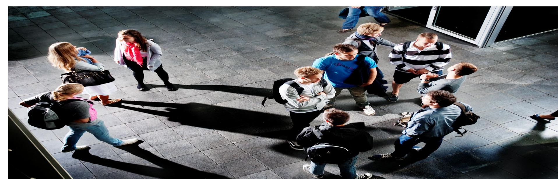
CIP ønsker at lægge mere vægt på den sproglige hverdag, som både studerende og ansatte indgår i på universitetet.